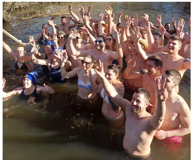
Am Samstag, den 07.03.2026 wurde traditionell auch in diesem Jahr wieder die Badesaison in Oberkemmathen eröffnet. Sowohl die Anzahl der Badenden als auch die große Zuschauerresonanz stellten einmal mehr neue Rekordmarken auf.