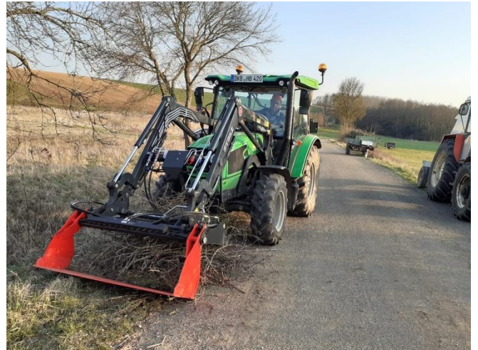
Im März 2026 kümmerte sich der Gartenbauverein Ammelbruch - auch mit der Unterstützung von reichlich „Pferdestärken“ - wieder voller Tatendrang um die Pflege der Langfurthener und Ammelbrucher Streuobstbestände.

den Erhalt unserer Streuobstbestände engagiert haben. Wir wissen Euren ehrenamtlichen Einsatz mehr als zu schätzen. Vielen Dank!