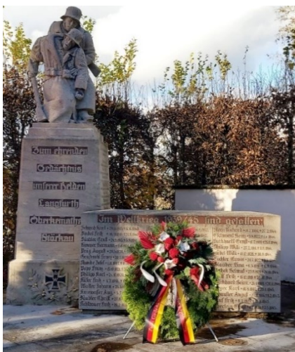
Auch in 2023 wurde an den Ehrenmälern in unserer Gemeinde wieder an die Kriegstoten und die Opfer von Gewaltherrschaft aller Nationen aus den beiden Weltkriegen erinnert.

Gemeindegebiet. Bei kaltem unangenehmen Regenwetter konnten wir - in unserer Gemeinde - am Sonntag, den 19.11.2023 den „Volkstrauertag“ miteinander begehen. In