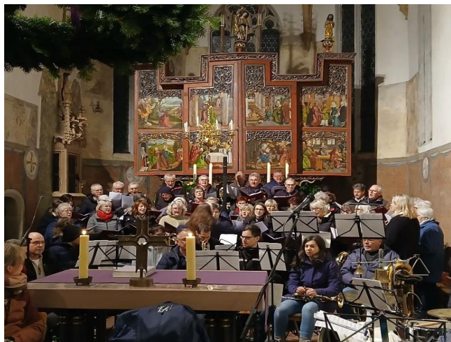
Der „gemischte Chor“ unter der Leitung von Monika Zischler und Katharina Jung trug neben „O heil'ge Nacht“ und „Merry Christmas allerseits“ noch drei weitere Lieder vor.