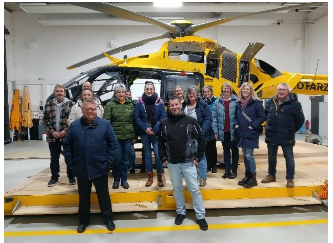
Freuten sich über einen interessanten und äußerst kurzweiligen „Informationsabend“ im Advent: Die Mitarbeitenden der Gemeinde Langfurth.