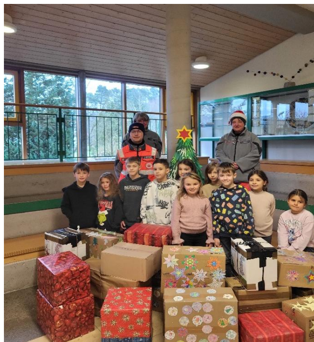
Eine wahrlich stolze Anzahl an schönen Geschenken konnte die Grundschule Langfurth-Burk im Advent 2025 für Bedürftige sammeln.

Langfurth. Die Grundschule Langfurth-Burk beteiligte sich natürlich auch heuer wieder an der Johanniter „Weihnachtsaktion“. Jede Klasse packte einen großen Karton, um anderen Menschen eine Freude zu machen. Da wir Sammelstelle sind, kamen in der Schule insgesamt 20 Kartons mit Lebensmitteln und kleinen Geschenken zusammen, über die sich Kinder mit ihren Familien freuen dürfen.